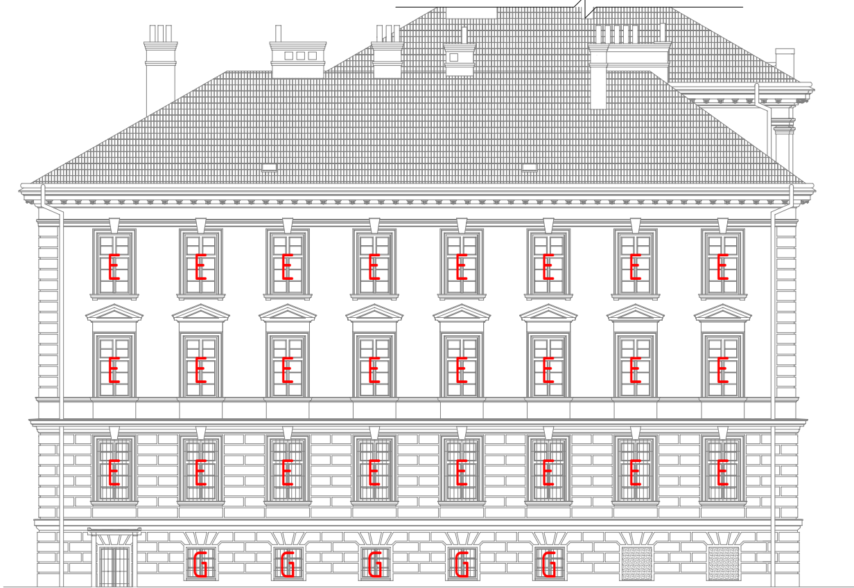
POHLED SEVEROVÝCHODNÍ - BOČNÍ KŘÍDLO